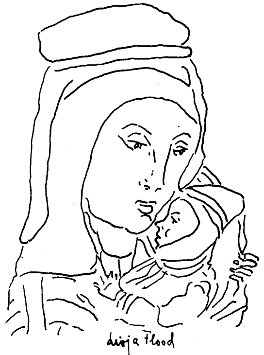
Livja Flood: «Vierge Lapone».

(Caverne des Arts. Chantilly du 3 au 27 octobre).